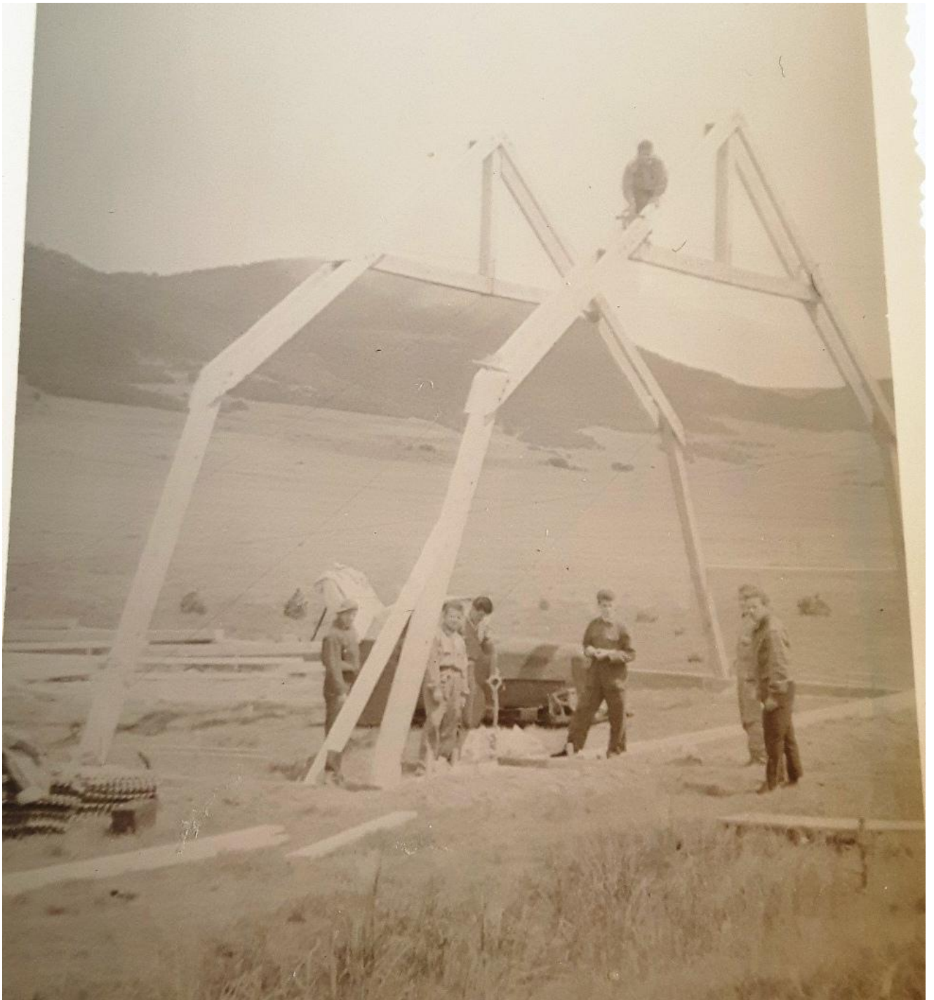
Les deux premières fermes, chancelantes.