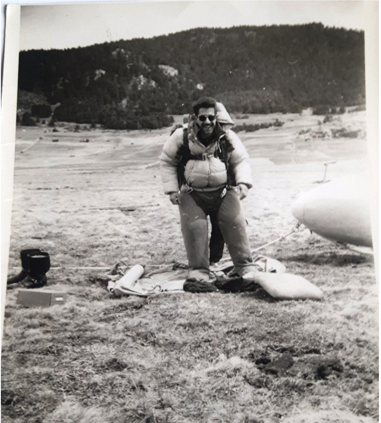
Au départ d'un vol d'onde, Lozio en duvet, devant le nez du Nord 200, et en arrière plan la pente ...