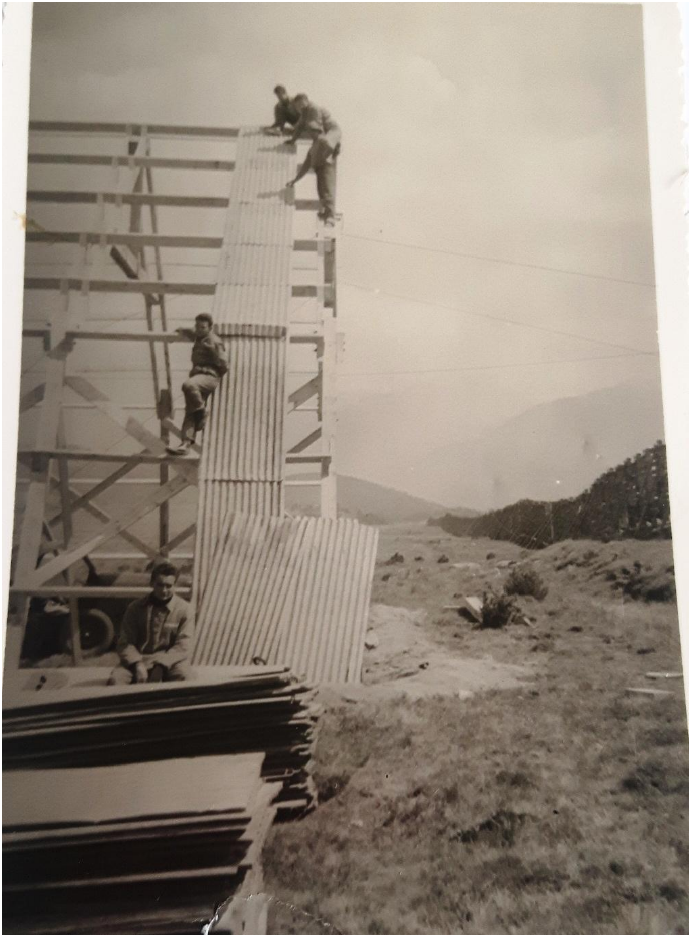
L'acrobatie (sans commentaires).